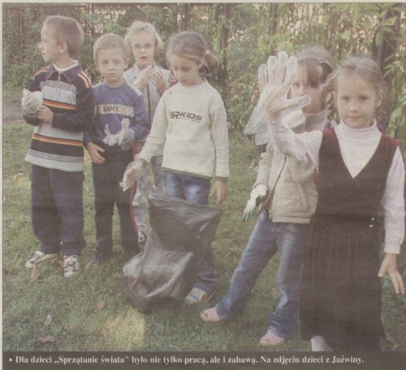
• Dla dzieci „Sprzątanie świata” było nie tylko pracą, ale i zabawą. Na zdjęciu dzieci z Jażwiny.

Do zorganizowania akcji przyczynili się m.in.: Urząd Gminy Łagiewniki, który zakupił rękawice, worki i zapewnił dzieciom dojazd oraz Zakład Usług Komunalnych, który wziął na siebie wywóz worków ze śmieciami.