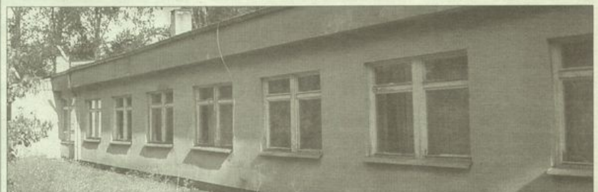
• Docelowo w byłym hotelu ma powstać około 15 – 20 mieszkań socjalnych.

eksperytyzę, przy drugim przeglądzie stanu technicznego obecni będą dekarze i inni specjaliści. Oszacowany zostanie koszt robót. Jeśli wydatki na ten cel nie przerosną możliwości gminy, będziemy kontynuować rozmowy z cukrownią, tak aby budynek przejąć na własność i zrealizować projekt budowy mieszkań – dodaje wójt. Docelowo w obiekcie ma powstać około 15 – 20 mieszkań socjalnych. Jeśli decyzja o realizacji planu będzie pozytywna, gmina będzie się starała o zabezpieczenie budynku i naprawę dachu jeszcze przed zimą.