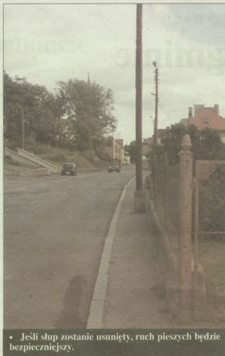
• Jeśli słup zostanie usunięty, ruch pieszych będzie bezpieczniejszy.