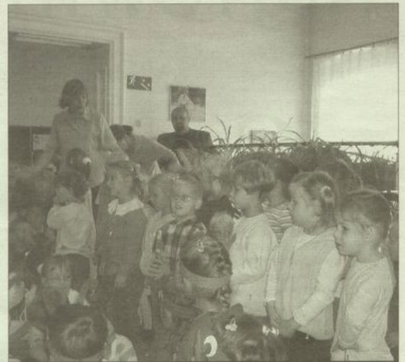
• Z roku na rok liczba przedszkolaków w Łagiewnikach rośnie.

Podczas uroczystości dzieci przedstawia program artystyczny prezentujący zajęcia, które w ciągu ostatnich pięciu lat wprowadzono do programu przedszkola. Będą pokazy z rytmiki, kinizjologii edukacyjnej, z języka angielskiego, z programu promocji zdrowia. Obejrzymy też inscenizację