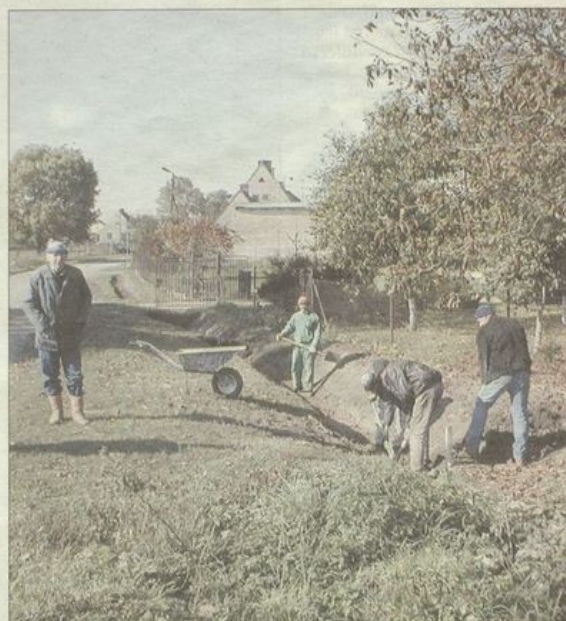
Pracownicy interwencyjni czyszczą rowy melioracyjne w Olesznej.

Koszty zatrudnienia pracowników pokryły po połowie Powiatowy Urząd Pracy i Urząd Gminy Łagiewniki.