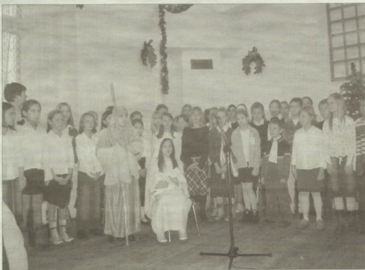
Występując przed mieszkańcami wsi, dzieci były w swoim żywiole – śpiewały i popisywały się swoimi umiejętnościami aktorskimi.