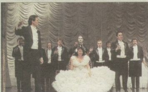
Traviata, G. Verdi