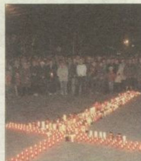
Z zapalonych zniczy ułożono wielki świetlisty krzyż.

Przyjmuję je do serca i staram się je realizować poprzez pracę i wychowanie zwłaszcza młodego pokolenia, które Papież tak przecież kochał. Najważniejsze, byśmy nie poprzestali na tym, co dzieje się z nami teraz, w okresie żałoby, byśmy naszą postawę doskonalili dalej, przelamując spory, podając bliźniemu rękę, kierując do niego dobre słowo. W górę serca, nie traćmy nadziei.