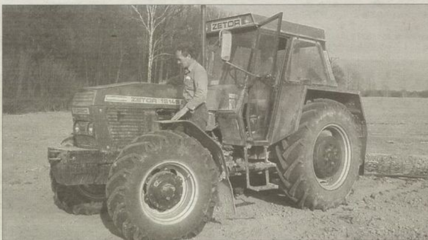
Rolnicy z gminy Łagiewniki powinni składać wnioski w biurze powiatowym ARiMR w Dzierżonowie.

Ci, którzy po raz pierwszy zamierzają złożyć wniosek o przyznanie płatności bezpośrednich do gruntów rolnych zobowiązani są do wystąpienia do ARiMR o nadanie im numeru identyfikacyjnego. Producenci rolni, którzy ubiegali się o przyznanie płatności w 2004 r., otrzymują z ARiMR za pośrednictwem poczty, częściowo wypełniony formularz wniosku (tzw. wniosek spersonalizowany) wraz z instrukcją jego wypełnienia.