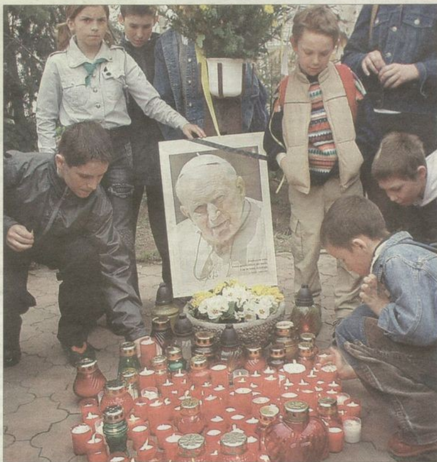
O świątelniku do nieba dla Papieża pamiętali nawet najmłodsi. Na zdjęciu dzieci z Olesznej.