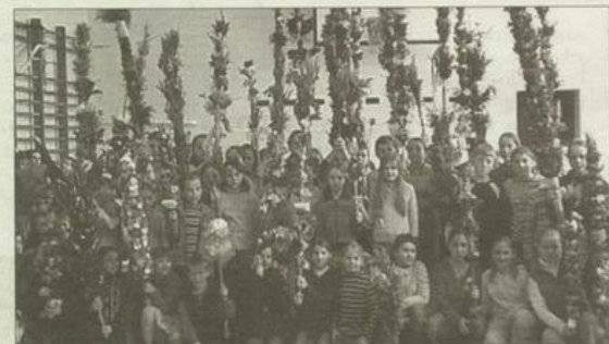
Na konkurs dzieci przygotowały piękne palmy.