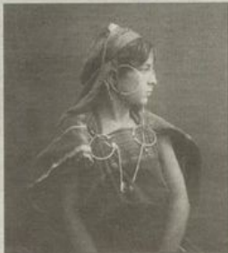
Beduńska dziewczyna - J. Garrigues, po roku 1880

Muzeum Sztuki Mieszczańskiej; Wrocław, Stary Ratusz. Czynne: śr.-sob. 11 - 17.00; nied. 10.00-18.00, bilety 7, 5 zł.