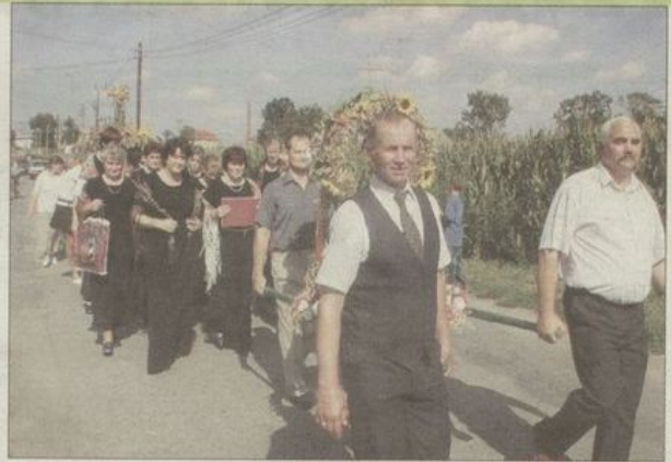
Reprezentacja Olesznej ze swoim dożynkowym wieńcem