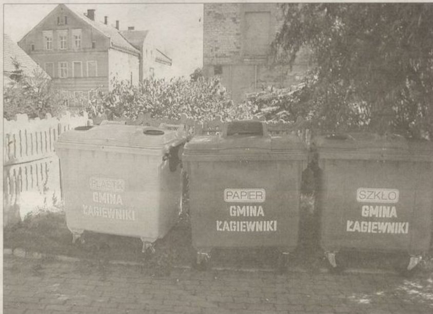
Pojemniki na surowce wtórne są wyraźnie oznakowane i różnią się kolorem, trudno więc o pomyłkę.

Warto zdać sobie sprawę, że jeśli nie będziemy przestrzegać prostych zasad obowiązujących przy segregacji śmieci, ta ekologiczna idea kompletnie straci sens. Zamarnowane zostaną pieniądze gminy, która na wpro-