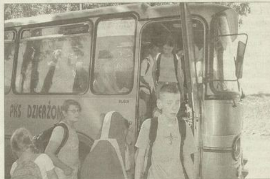
Dzieci dowożone są do szkoły trzema autobusami.