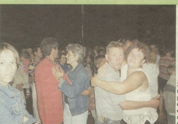
Zabawa taneczna pod gwiazdami trwała do wczesnych godzin rannych.