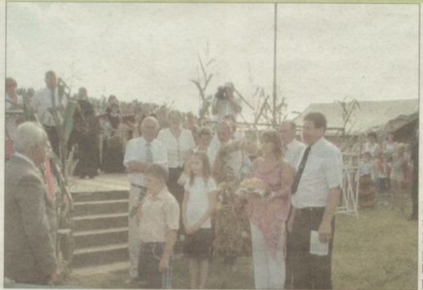
Reprezentacja Przystronia przekazuje bochen chleba wójtowi.