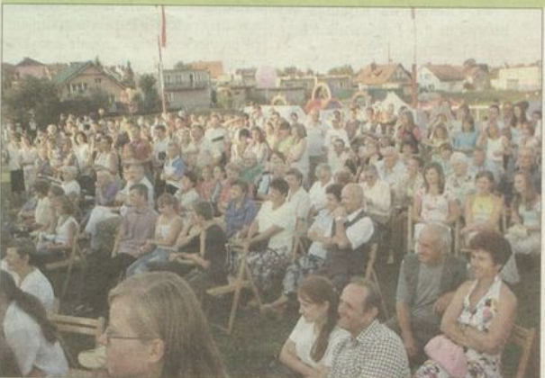
Występy artystyczne wzbudzały duże zainteresowanie.