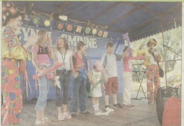
Para klaunów bawiła nasze pociechy.