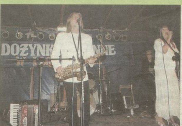
Gwiazda wieczoru grupa 2+1 została gorąco przyjęta przez publiczność.