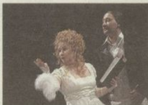
Arkadia w reż. Krzysztofa Babickiego