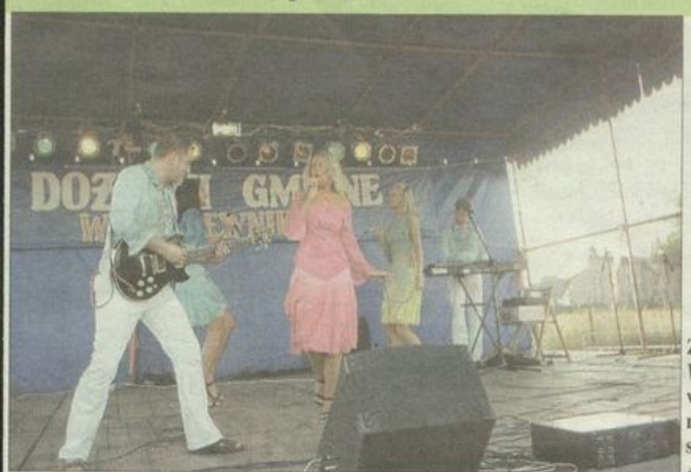
Zespół Waterloo wystąpił z repertuarem szwedzkiej Abby.