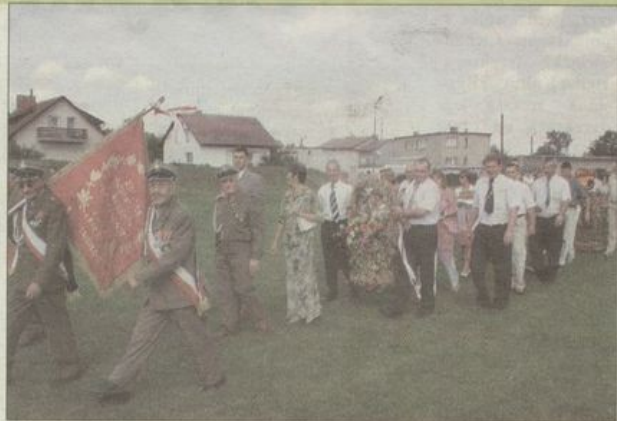
Za kombatantami kroczył starostowie dożynek, za nimi delegacja z Przysronia.