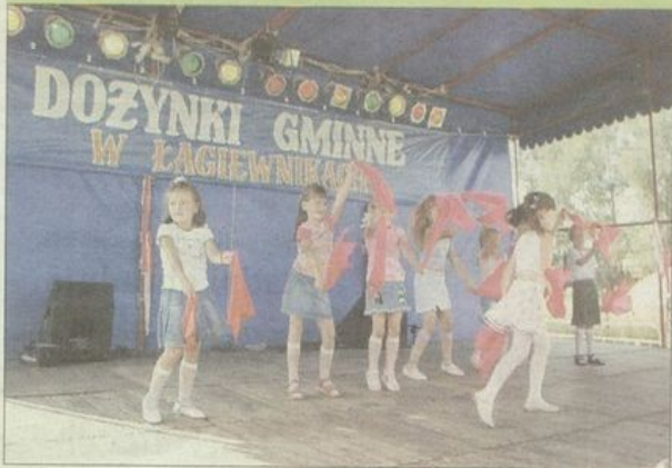
Dzieci z przedszkola łagiewnickiego swoim występem wzruszyły nie tylko rodziców.