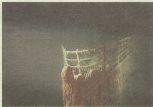
Titanic.

TOWARZYSTWO NATIONAL GEOGRAPHIC od chwili jego powstania w 1888 roku po dzień dzisiejszy. Dowodzą one, że bez ogromnej ludzkiej determinacji i chęci poznawania świata nie dokonano by żadnego z wielkich odkryć.