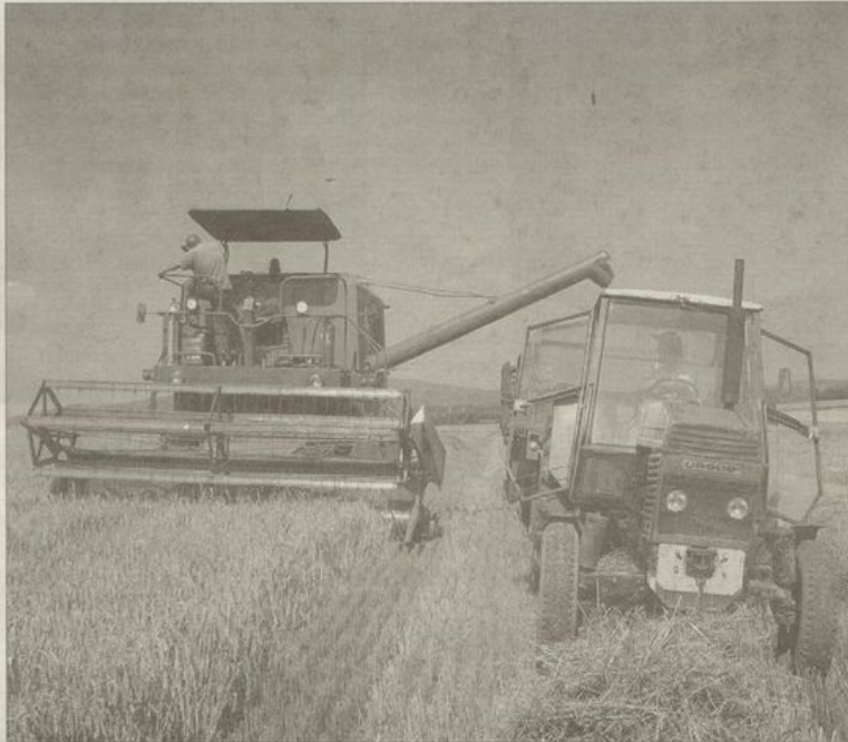
Rolnicy zdążyli na czas. Po dożynkach większość pól była już skoszona.