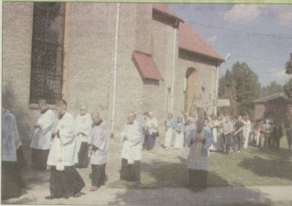
Obchody święta plonów rozpoczęła msza święta i procesja.