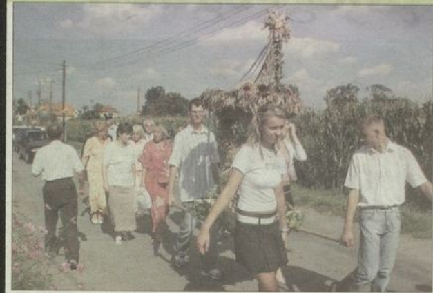
Delegacja ze Słupic