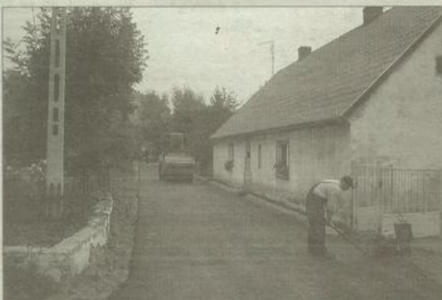
Ulica Dolna ma już nową nawierzchnię asfaltową.

W październiku zamieszka w budynku jedna rodzina; pozostałe rodziny mające zasiedlić budynek wybrane zostaną na początku 2006 roku, po analizie wniosków przez komisję mieszkaniową. Socjalne lokale mieszkalne będą przyznawane osobom w bardzo trudnej sytuacji materialno-mieszkaniowej. Na remont hotelu gmina przeznaczy w latach 2005-2006 około 150 tys. złotych.