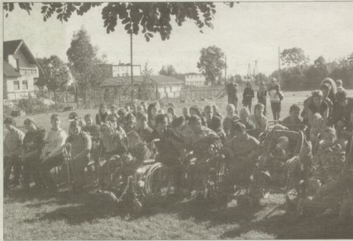
Spotkanie miało charakter imprezy rekreacyjnej.

Za okazaną pomoc, dobroć i wsparcie rzeczowe oraz finansowe, za osobiste zaangażowanie dyrekcja szkoły i organizatorzy składają wszystkim bardzo gorące podziękowania.