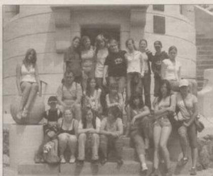
Fakt złożenia przyrzeczenia na Wielkiej Sowie ma dla harcerzy szczególne znaczenie.