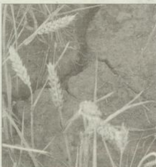
Straty z powodu suszy sięgają 80%.

Kłęska suszy spowodowała straty w 420 gospodarstwach na terenie gminy Łagiewniki. Skutki kłęski poniosły uprawy na siedmiu tysiącach hektarów gminnych ziem uprawnych.