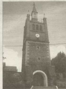
Część kosztów renowacji zabytków można pokryć z dotacji.

środki z budżetu gminy na prace remontowe przy zabytku może się starać każdy podmiot będący właścicielem lub mający do zabytku tytuł prawny. Dotacja może wynieść nawet 50% wartości wykonanych prac remontowych, jeśli zabytek posiada wyjątkową wartość historyczną, artystyczną lub naukową. Jeśli natomiast sytuacja wymaga niezwłocznego podjęcia prac budowlanych przy zabytku, dotacja może pokryć nawet 100% kosztów.