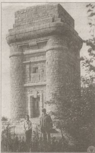
Wieżyca (Sobótka) - 1910 r., poniżej w roku 2006

Wieża na Jańskiej Górze wzniesiona została w 1869 roku przez właściciela majątku ziemskiego w Wättrisch (dzisiejsza wieś Sokolniki) Friedricha Schrötera (1820-1888). Do budowy (koszt 18 000 marek) obiektu o wysokości ok.