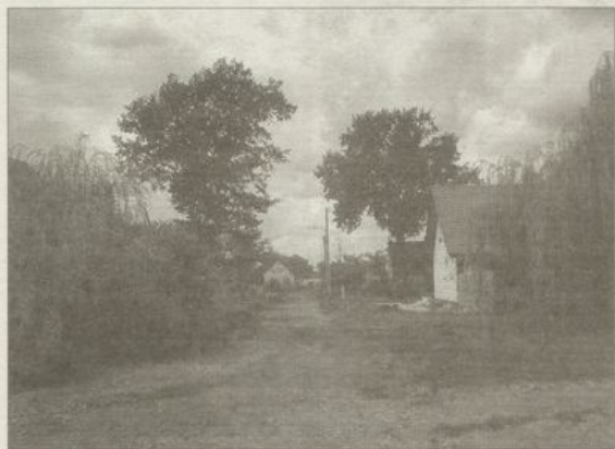
Droga w Sienicach przed remontem.

Po zakończeniu tego remontu, wykonawca przystąpi do prac w Radzikowie.