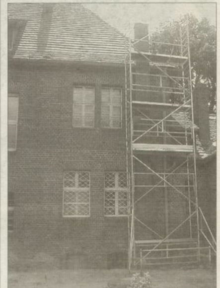
Komin dobrze wkomponowano w bryłę budynku.

Komin przylega do jednej ze ścian elewacyjnych budynku. Choć jest sporych rozmiarów, wkomponowano go tak, by harmonijnie współgrał z bryłą całości. W kominie zainstalowany został nowy wkład, całość przyłączona jest do nowego pieca, co gwarantuje bezpieczeństwo systemu grzewczego. Budowa kominu kosztowała 11,5 tys. zł.