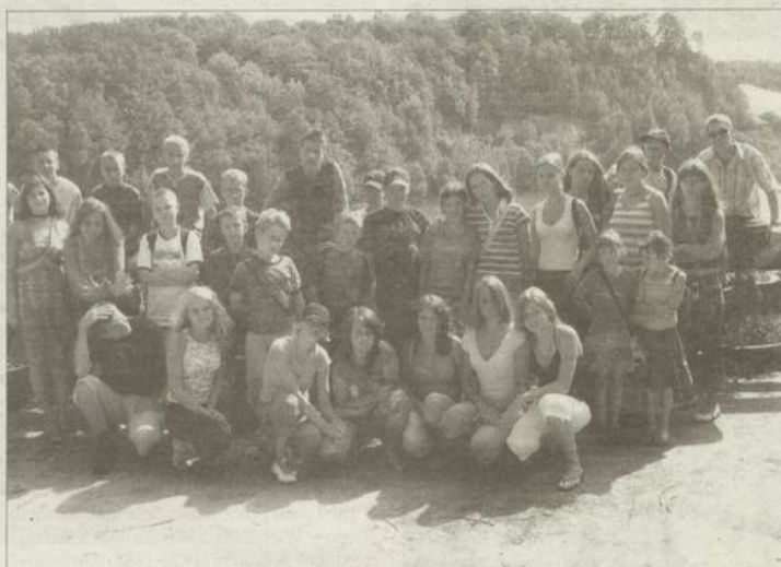
Nie ma obozu harcerskiego bez pamiątkowego zdjęcia.

Oprócz wycieczek, olimpiad, dyskotek, każdy obozowicz musiał pełnić wartę, przyjąć służbę na stołówce, pozmywać po sobie męzną, przeprać swoje ubrania. Oczywiście rano pobudka i zaprawa, która po pierwszym