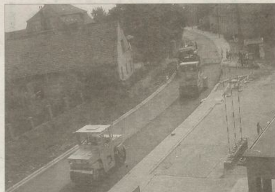
Zarówno w pracach na ulicy Jedności Narodowej, jak i na skrzyżowaniu z drogą krajową widać wyraźny postęp.

- Nie tylko kierowcy, ale i mieszkańcy są już zapewne zmęczeni tymi uciążliwościami w komunikacji, dodatkowo kurzem i hałasem, który wiąże się z remontem. Widać jednak wyraźny postęp w pracach, jesteśmy na zaawansowanym etapie realizacji zadania. Wykonawca bardzo się stara, pracownicy są przy maszynach od 7.00 rano do 18.00, nawet 19.00 wieczorem – podkreśla wójt. - Tempo jest zadowalające, a i jakość wykonywanych prac spełnia nasze oczekiwania. Oczywiście regulamie