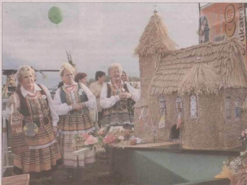
Członkinie zespołu Górzanie podziwiają zwycięski wieńiec dożynkowy.

W tym roku, tradycyjnie w ostatnią niedzielę sierpnia (27.08.2006), obchodziliśmy specjalne - gminno-powiatowe dożynki. Tegoroczne obchody Święta Plonów rozpoczął koncertem w kościele chór Canzona, następnie odbyła się msza święta. Jakże zdziwieni byli ci, którzy po mszy wyszli z kościoła, by w uroczystym pochodzie przejść główną ulicą w kierunku stadionu – zamiast świecącego wcześniej słońca na niebie, zastał ich ulewny deszcz... Kaprys pogody nie zniechęcił jednak władz gminy i powiatu, kombatanów, delegatów, przedstawicieli poszczególnych sołectw – ze sztandarami i wieńcami dożynkowymi przeszli oni w barwnym pochodzie przez miejscowość. W końcu jednak deszcz przestał padać, słońce wyjrzało zza chmur. Przy akompaniamentem debiutującego zespołu Fermata na stadionie przywitano gości, w tym gości honorowych: wójta gminy