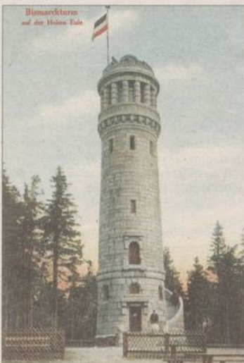
Wieża na Wielkiej Sowie - rok 1907, poniżej stan po remoncie, 2006

Więcej o wieżach Bismarcka: www.bismarcktuerm.de .