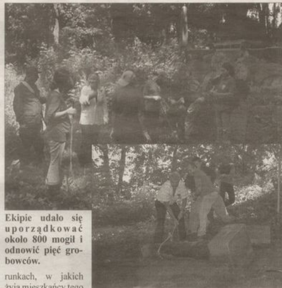
Ekipie udało się uporządkować około 800 mogił i odnowić pięć grobowców.