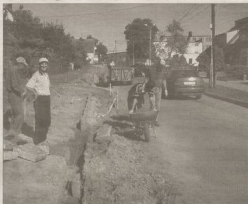
Ulica Sportowa będzie szersza, dobudowane zostaną chodniki. Dzięki temu dojazd do stadionu i nad tamę będzie bezpieczny.

– To dla nas bardzo dobry interes, ponieważ w ten sposób niewielkim kosztem będziemy mieli kolejną zmodernizowaną drogę w gminie – podsumowuje wójt.