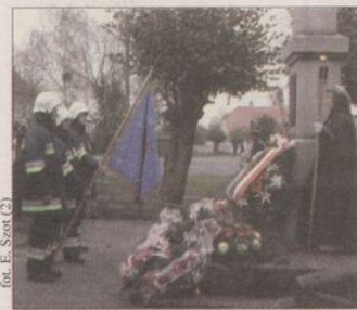
fol. E. Szot (2)

„Poland does exist! I am Polish” („Polska jest! Ja jestem Polakiem!”) - te słowa wypowiedziane podczas programu artystycznego przygotowanego przez uczniów Gimnazjum im. Piastów Śląskich w Łagiewnikach wywarły największe wrażenie na widzach zgromadzonych, jak co roku, w GOKiB w Łagiewnikach. Słowa okazały się poruszające zapewne dlatego, że mimo upływu ponad stu lat, są nadal aktualne.