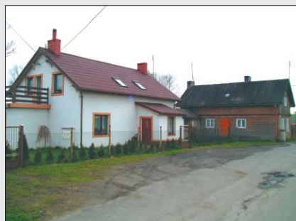
Dot. Tadeusz Srota