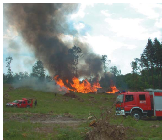
Dot. Tadeusz Srota