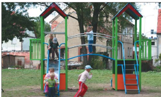
Plac zabaw w Łagiewnikach był bardzo potrzebny. Świadczy o tym radość dzieci.