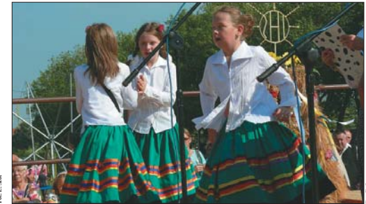
Młode pokolenie tańcem i śpiewem rozgrzewało publiczność.