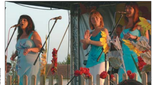
Popołudnie i wieczór upłynęły w pogodnych rytmach piosenek w wykonaniu zaproszonych zespołów. Na zdjęciu zespół ZORBA ze swoim greckim repertuarem.