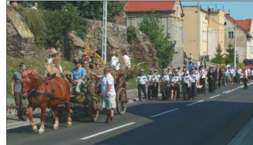
Przy akompaniamentie orkiestry dętej korowód dożynkowy przeszedł ulicami Łagiewnik.