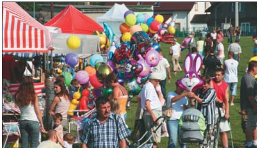
Z dożynek można było przynieść nie tylko z uśmiech, ale i kolorową pamiątkę.