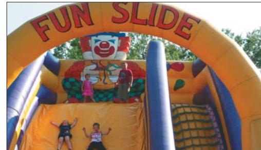
Dzieci nie trzeba było zachęcać do zabawy. Od razu ruszyły na podbój zorganizowanego na tę okazję wielkiego placu zabaw.