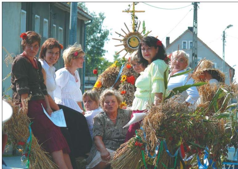
Panie z Jaźwiny wybrały się na święto plonów dożynkową „taksówką”.

Po słowach powitania na scenie kolejno stawały się delegacje poszczególnych sołectw z pięknymi wieńcami dożynkowymi. Kiedy wieńce zostały już złożone, wójt pokroił chleb i zaczął nim częstować gości. Uroczystą atmosferę zapewniał chór Poiana, następnie wystąpiła orkiestra dęta SART z Bielawy. W konkursie na najpiękniejszy wieńiec dożynkowy zwyciężyły: sołectwo Jaźwina (I m. – „za zachowanie tradycji”), sołectwo Sienice (II m. – „za