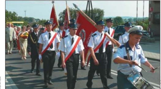
Poczęty sztandarowe strażaków prezentowały się nadzwyczaj dostojnie.