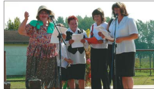
Ekipa ze Stoszowa, jak zwykle w „okolicznościowych” strojach i z całym zapasem dowcipów.