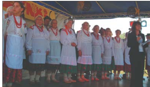
Pełne radości przywitanie przygotował wielopokoleniowy Chór Górali Czadeckich POIANA.