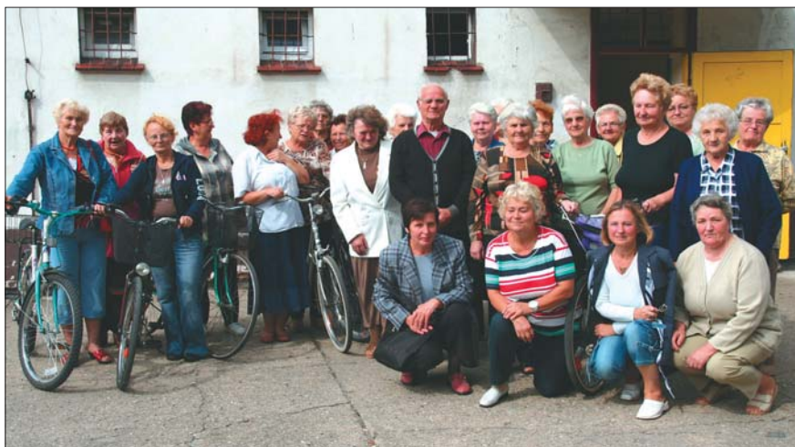
Seniorzy mają bardzo dużo energii twórczej, ale i fizycznej – wiele z nich na spotkania przyjeżdża na rowerze.

P rężnie działający łagiewnicki Klub Seniora ma prawdziwe powody do satysfakcji. Od prawie miesiąca dysponuje własnym lokalem – salą, w której seniorzy mogą regularnie się spotykać i organizować rozmaite zajęcia czy imprezy. Przejście sali nie powiedziałoby się, gdyby nie ogromne zaangażowanie samych zainteresowanych.