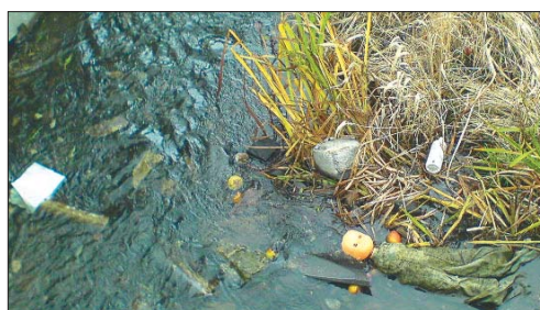
Taki widok zastaliśmy tuż obok placu zabaw, w pobliskiej rzeczce.