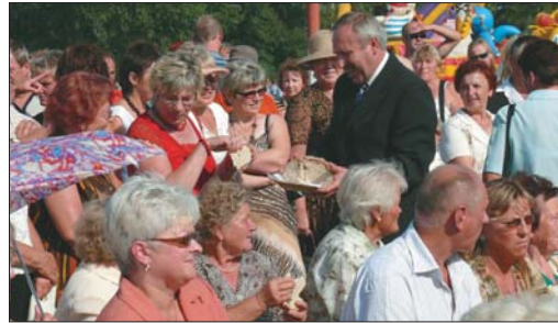
- Chciałbym, aby ten podział był sprawiedliwy. Niech nigdy i nikomu nie zabraknie chleba - mówił wójt, dzieląc się symbolicznie dożynkowym bochenem.