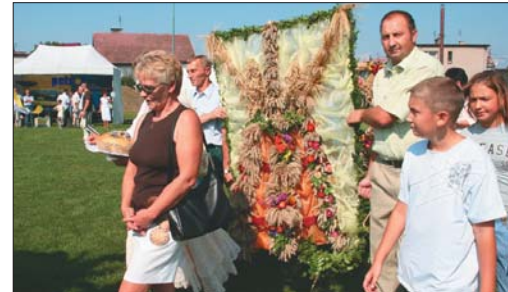
Reprezentacja sołectwa Ligota Wielka.