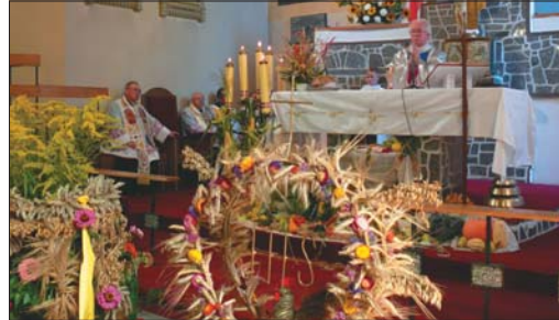
Uroczysta msza święta, która rozpoczęła tegoroczne uroczystości dożynkowe, odbyła się w pięknie udekorowanym kościele pw. Matki Boskiej Częstochowskiej.