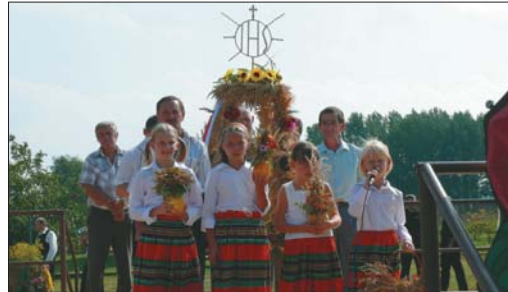
Delegacja sołectwa Łagiewniki przedstawia program artystyczny, w którym nie zabrakło słowa poezji i wesołej piosenki.