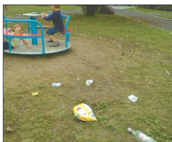
Niestety, na placu „uczują” też dorośli, pozostawiając po sobie stopy ordynarnych śmieci.