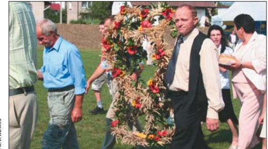
Wieniec dożynkowy przygotowany przez sołectwo Ratajno.