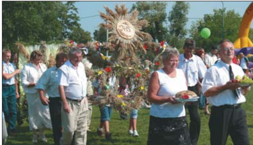
Niezwykle zdobny wieniec dożynkowy oraz dary niosą przedstawiciele sołectwa Sienice.