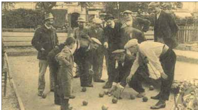
Gra w bule – Paryż, początek XX wieku