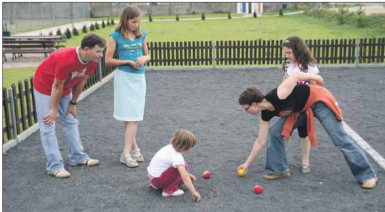
Gra w bule – Łagiewniki, początek XXI wieku