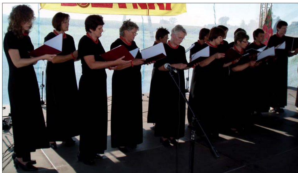
Chór „Canzona” swoimi pieśniami nadawał uroczystości podniosły ton.