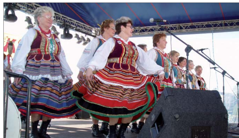
Były też momenty „z przytupem”. Na scenie zespół Pieśni i Tańca „Górzanie” z Piławy Górnej.