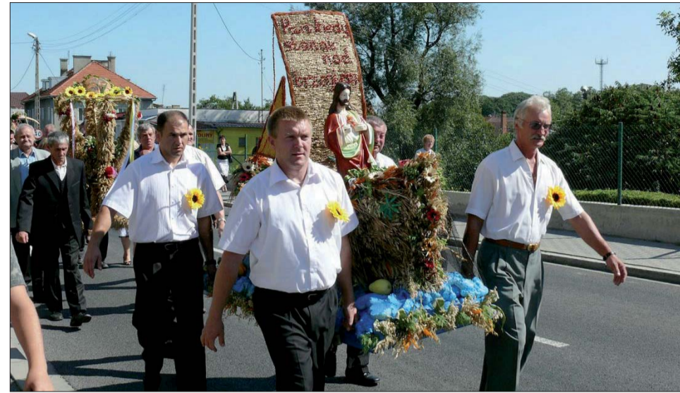
Figurka Chrystusa na łodzi była głównym elementem dożynkowego wieńca przywiezionego przez sołectwo Sienice.