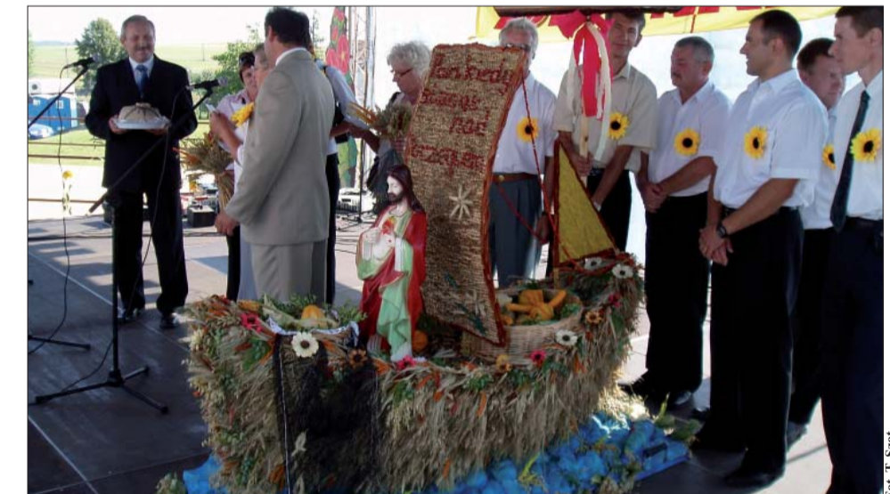
Podczas przekazywania bochnów chleba wójt dziękował rolnikom za całoroczny trud i ciężką pracę. Na zdjęciu delegacja sołectwa Sienice.