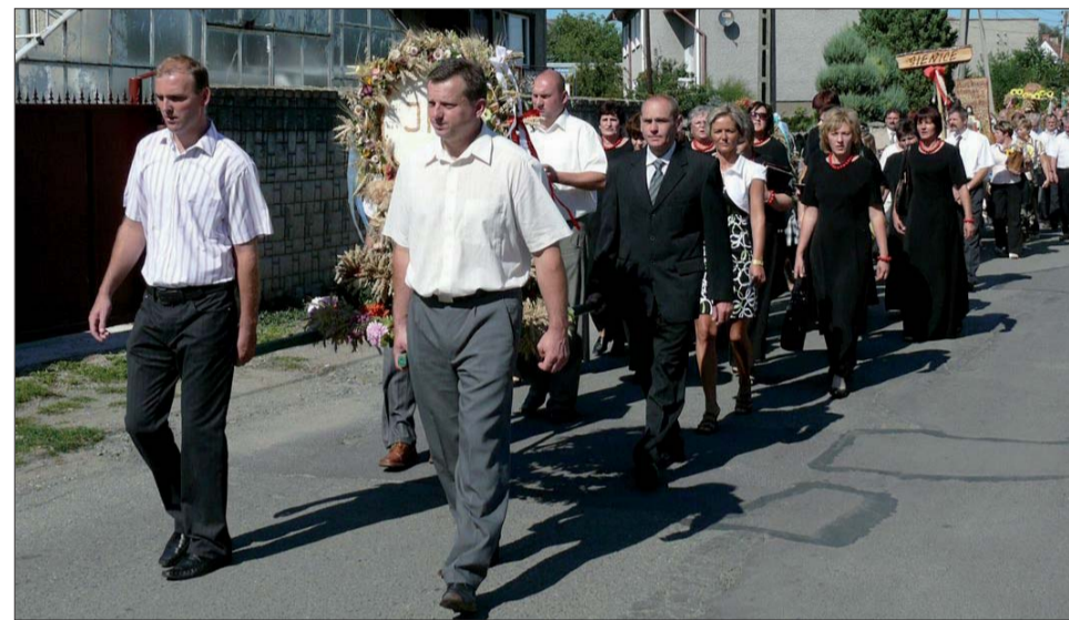
Za delegacją sołectwa Oleszna dumnie kroczą „czarne damy” z chóru „Canzona”.