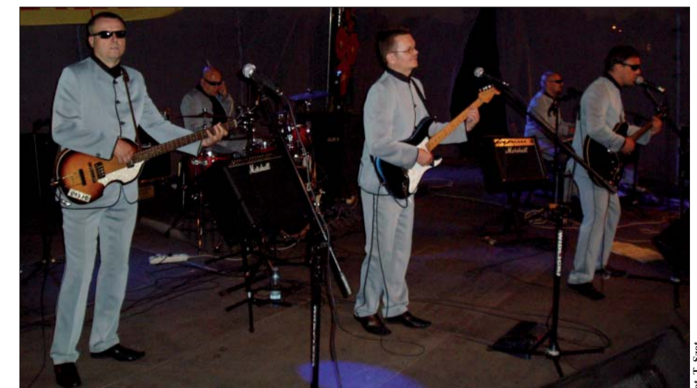
Publiczność rozruszała się na dobre przy znanych przebojach w wykonaniu zespołu „Chrzyszczę”.