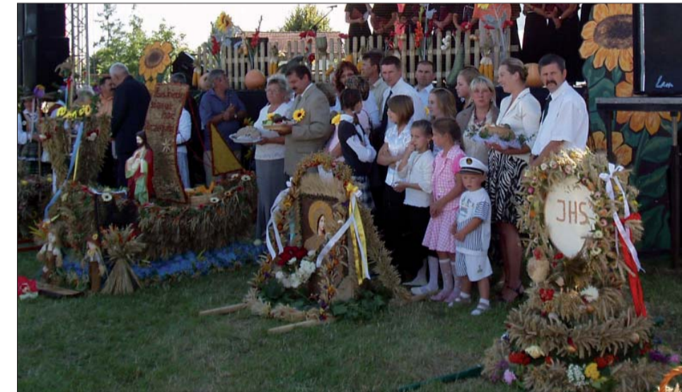
Wieńce prezentowały się pięknie, zwłaszcza kiedy obok stali ci, którzy przyłożyli się do ich powstania.