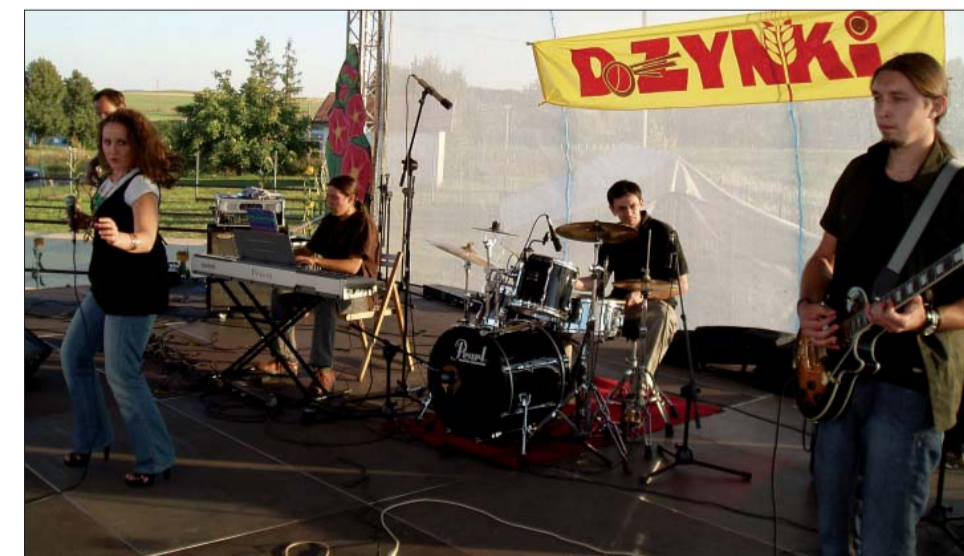
Późnym popołudniem na scenę weszli muzycy z zespołu „Helikopter”.