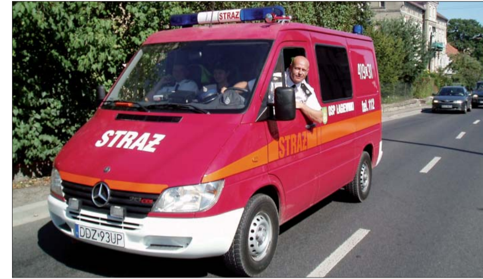
Strażacy na dożynki przyjechali swoim nowym, specjalistycznym vozem.