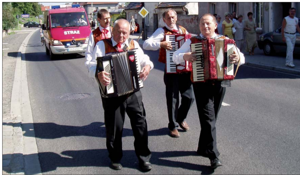
Uczestnicy korowodu nie mieli kłopotu z utrzymaniem równego kroku, bo przygrywali im rytmicznie akordeoniści z Zespołu Pieśni i Tańca „Górzanie” z Piławy Górnej.