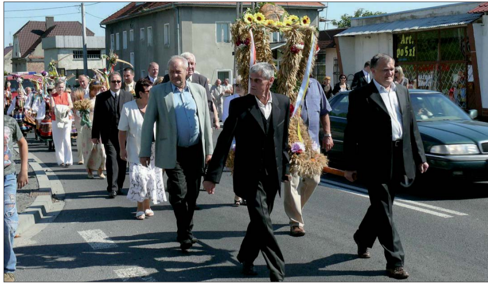
Korowód dożynkowy nie byłby tak barwny, gdyby nie kostiumy i wieńce niesione przez przedstawicieli poszczególnych sołectw. Tu przedstawiciele sołectwa Łagiewniki.