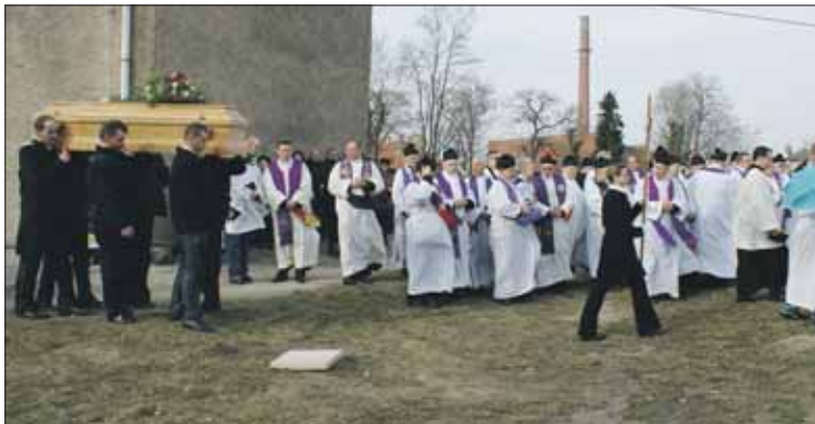
Na uroczystości pogrzebowe przybyła bardzo liczna reprezentacja duchowieństwa.