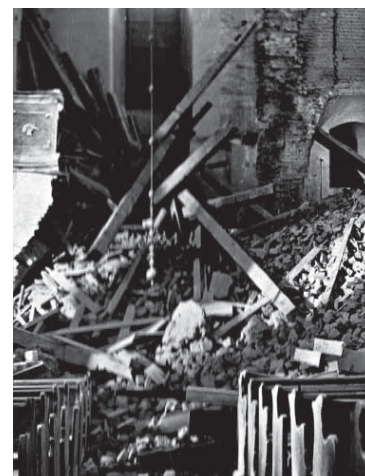
Tak po katastrofie wyglądało wnętrze kościoła w Górze Śląskiej.