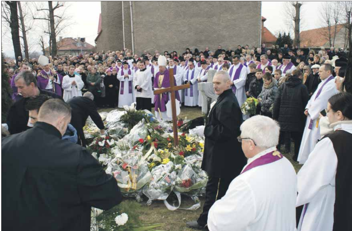
W pogrzebie uczestniczyły setki wiernych z Łagiewnik i sąsiednich miejscowości.