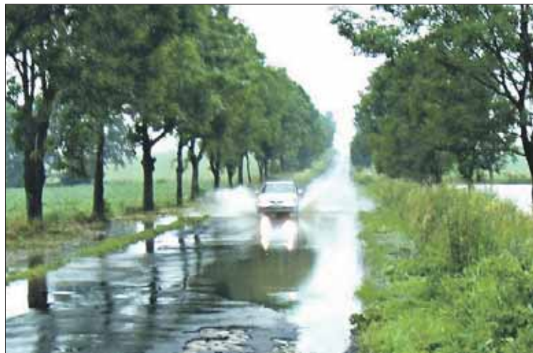
Przejazd przez drogę pomiędzy Łagiewnikami i Oleszną nie był łatwy.